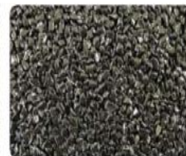
Nero Ebano (Schwarz)